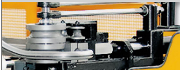
PROVAR 5 U-D