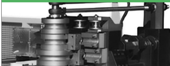
PROVAR 6 U-D