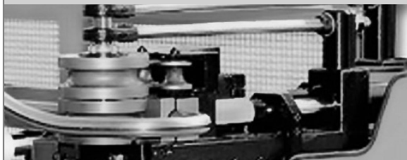
PROVAR 5 U-D