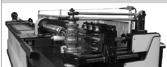
PROVAR 6 U-D